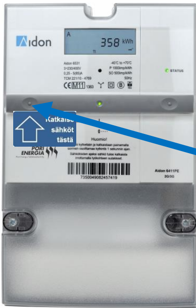
3-vaihe mittari (Aidon 6000)

Oheisista kuvista näet KytKentä-katkaisu painikkeen ja sen toimintaan liittyvän merkkivalon selitykset.