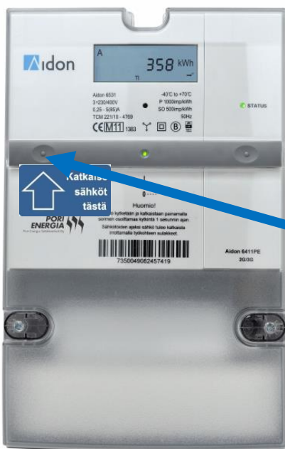
3-vaihe mittari (Aidon 6000)

Oheisista kuvista näet KytKentä-katkaisu painikkeen ja sen toimintaan liittyvän merkkivalon selitykset.